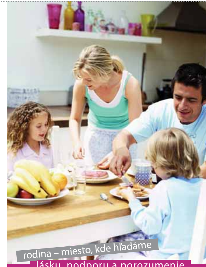
rodina – miesto, kde hľadáme lásku, podporu a porozumenie

Pre slovenskú spoločnosť sú charakteristické veľké regionálne rozdiely, ktoré v chudobnejších regiónoch zapríčiňujú takmer absolútnu nemožnosť nájsť si akékoľvek zamestnanie, čo spôsobuje aj neschopnosť zabezpečenia základných potrieb rodiny v intenciách uspokojenia sociálnych a kultúrnych potrieb rodiny, resp.