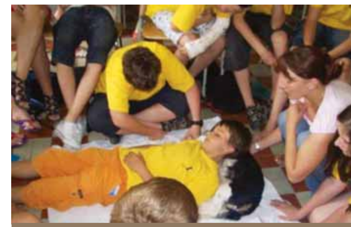
Polohovanie (Deň mladého prírodovedca 2012 UMB Banská Bystrica)

Poskytovať canisterapeutické služby je náročný a dlhodobý proces. Vstupovanie do primárneho liečebného postupu canisterapiou si vyžaduje trpezlivosť a odborný prístup. Dlhodobosť sa začleňuje do liečby klienta a tak i do jeho bežného života.