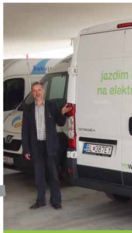
Spoločnosť MED-ART už pomáha aj v ďalšom rozmere – ekologickejšom.

Pri začiatkoch spolupráce sa zvyčajne uzatvárajú zmluvy, odovzdávajú kľúčiky, blýskajú objektívy fotoaparátov.