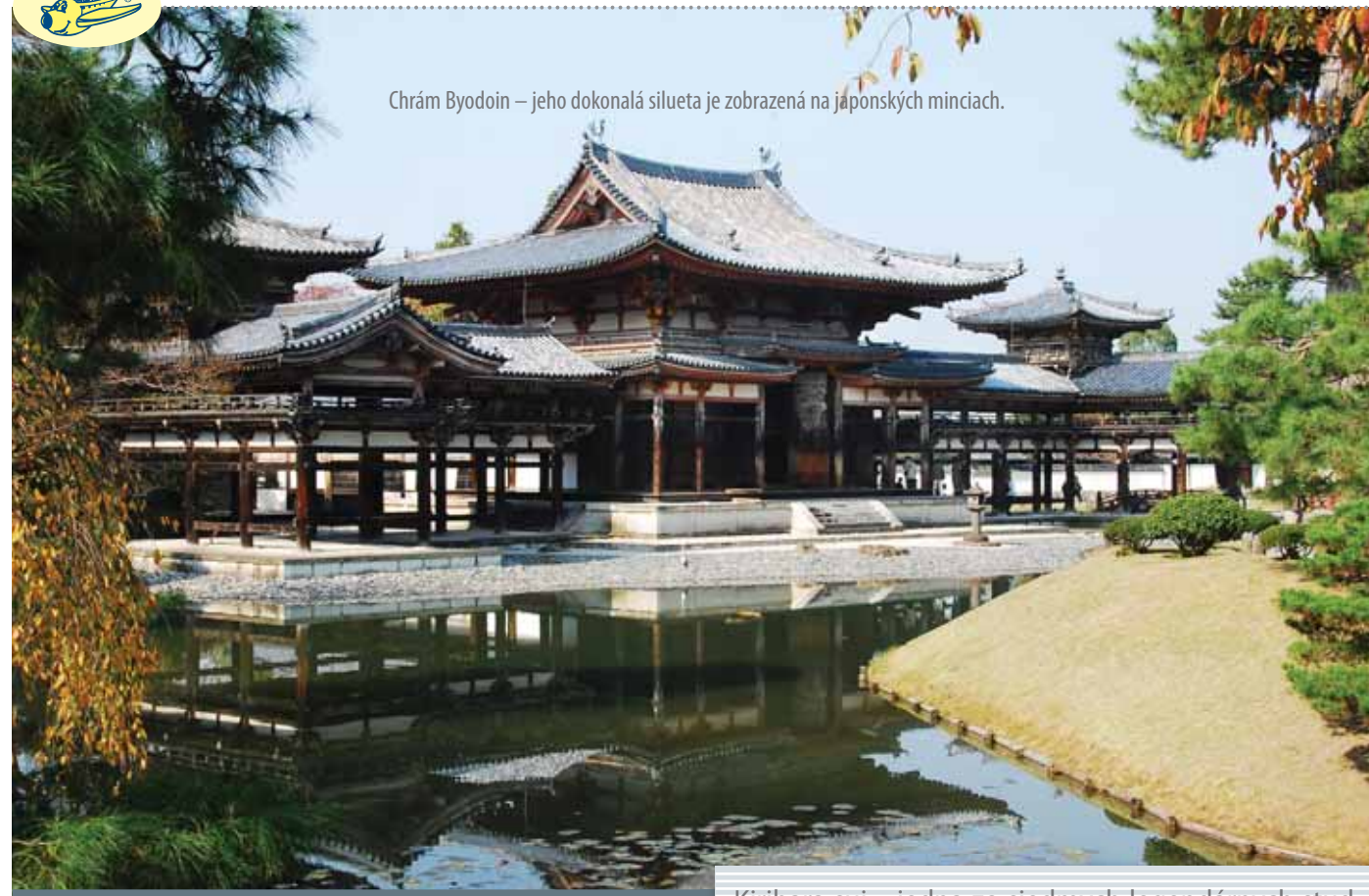
Chrám Byodoin – jeho dokonalá silueta je zobrazená na japonských minciach.