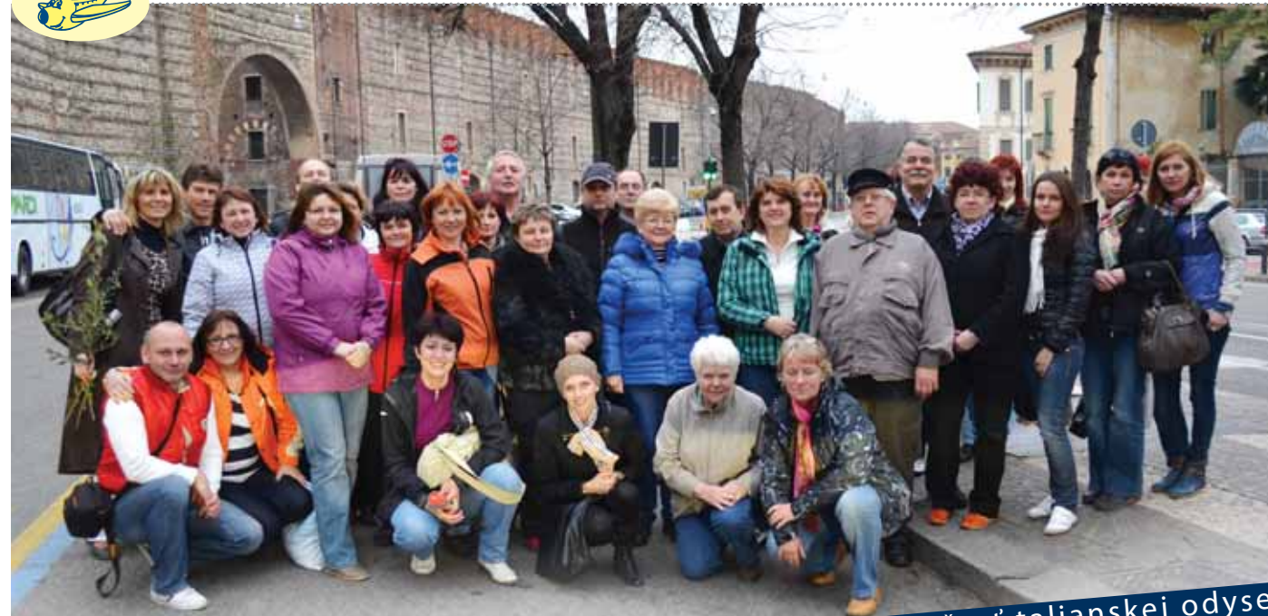
d'alsia časť talianskej odysey

V dňoch 22. až 24. marca sme sa zo zasneženého Slovenska vydali na potulky po jarnom slnečnom Taliansku. Cieľom tohtoročného putovania po Taliansku sa stala antická, stredoveká a moderná Padova a krásne mesto umenia a lásky Verona. Dopriali sme si aj malú zastávku na relax v kúpeľnom mestečku Montegrotte neďaleko Padovy v hoteli Terme Patrarca. Kto sa tešil na pokračovanie poznávania Talianska, tak ten si určite prišiel na svoje.