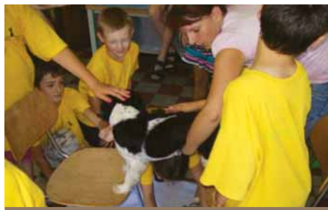
Podliezanie psa – rozvoj hrubej motoriky. (Detská univerzita 2012 UMB Banská Bystrica)