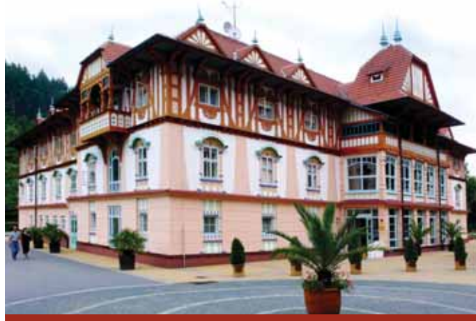
Kúpeľný hotel Jurkovičov Dom*** je národnou kultúrnou pamiatkou a najznámejšou dominantou kúpeľného centra Luhačovic.

Narodil sa 23. augusta 1868 v Brezovej pod Bradlom, kde vyrastal aj Milan Rastislav Štefánik, s ktorým ho, ako neskôr spomeniem, mnohé spájalo. Štúdium absolvoval v Brezovej, Skalici, Šoproni i vo Viedni. Po štúdiách pracoval vo Vsetíne, neskôr v Brne, kde sa aj oženil s dcérou stavebného podnikateľa Bartelmusa a mal troch synov. Toto obdobie ho veľmi ovplyvnilo v jeho tvorbe a umožnilo mu profesne sa osamostatniť. A tak uzreli svetlo sveta jeho prvé stavby na Morave – kaplnky krížovej cesty na pútnickom vrchu Hostýn a na Pustevniach na Radhošti (aj ubytovne Libušín, Maměnka), ktoré sa mu mimoriadne vydarili a otvorili mu cestu k titulu – „najvyhládavanejší a najvýznamnejší architekt“ tej doby. Tvoril pre významné firmy, inštitúcie, mestské samosprávy, podnikateľov a mnohé osobnosti. V tomto období (polovica dvadsiatych rokov) orientoval svoju tvorbu na výstavbu kúpeľného komplexu Luhačovice, ktoré sa po dobudovaní stali významným klenotom modernej československej architektúry, lebo predstavovali nádhernú ukážku československej vetvy európskej secesie. Mnohí z vás tieto kúpele napokon dobre poznáte.