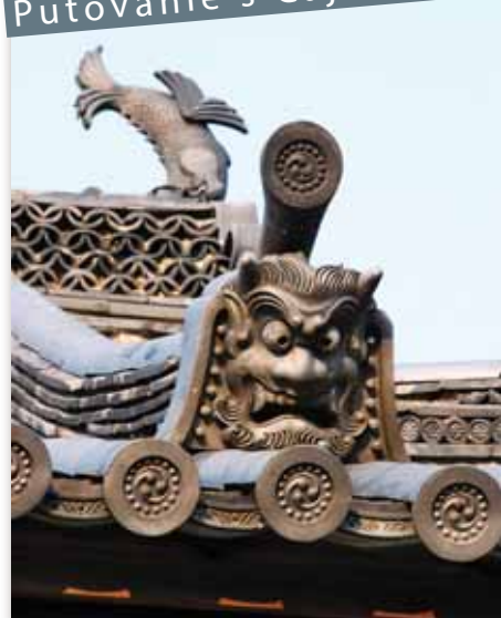
Dokonalosť v každom detaile – strecha chrámu Košodži.