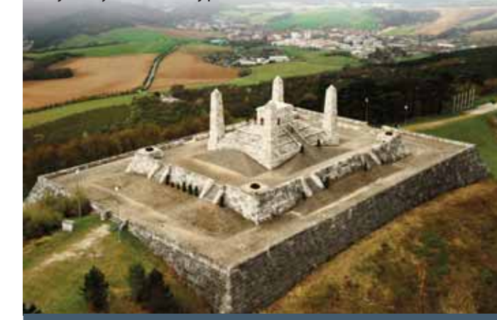
Charakteristická bielo sa skvúca terasovitá stavba so štyrmi obeliskami predstavuje typickú čistotu architektonického prejavu D. S. Jurkoviča v zosúladiení s okolitou krajinou.

Ale vráťme sa k nášmu D. S. Jurkovičovi. V období prvej Slovenskej republiky ako známy Čechoslovák (bol zástancom Česko – Slovenskej vzájomnosti a demokracie) odišiel z verejného života a spoločensky sa odmlčal. Proti totalite a násiliu viedol vlastnú vojnu, cez svoje diela, čo sa premietlo do početnej série nádherných, ale utopistických návrhov na pamätníky obetiam a udalostiam vojny (Lidice, Stalingrad...) či významným národným a kultúrnym dejateľom, z ktorých sa však napokon zrealizovali iba dve: pamätník v Kremničke a pomník na cintoríne v rodnej Brezovej. Po II. svetovej vojne sa opätovne začal zapájať do umelecko-spoločenských aktivít, ktorých rozvoju však zabránila náhla smrť. Skonal 21. decembra 1947 v Bratislave a pochovaný je v spomínanej mohyle v Brezovej pod Bradlom.