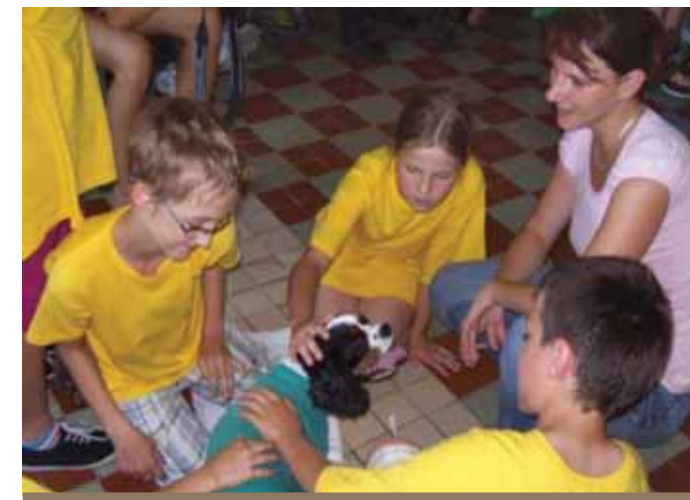
Obliekanie psa – rozvíjanie jemnej motoriky.

Príkladom využitia tejto formy canisterapie sú návštevy v domovoch dôchodcov, detských zariadeniach, nemocniciach, prípadne v nápravno-výchovných zariadeniach.