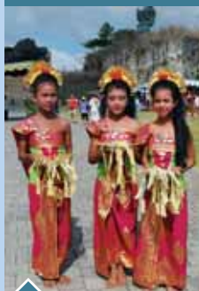
❖ Balijské tanečnice

Návšteva najväčšieho budhistického monumentu Juhovýchodnej Ázie – Borobudur, obed a návšteva najväčšieho hinduistického komplexu na južnej pologuli – Prambanan. Prehliadka dediny na úpätí sopky Merapi. Večer návrat do hotela a voľný program.