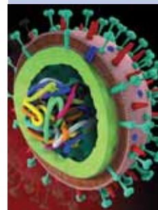
model vírusu chrípky a vírus pod mikroskopom

Pri rýchlom šírení ruskej chrípky bol priebeh ochorenia pomerne mierny a postihoval prevažne osoby mladšie ako 25 rokov. Pri antigénnej a molekulárnej charakterizácii sa zistilo, že vírus, ktorý vyvolal ruskú chrípku, má oba antigény (hemaglutinín a neuraminidázu) pozoruhodne podobné chrípkovému vírusu v roku 1950.