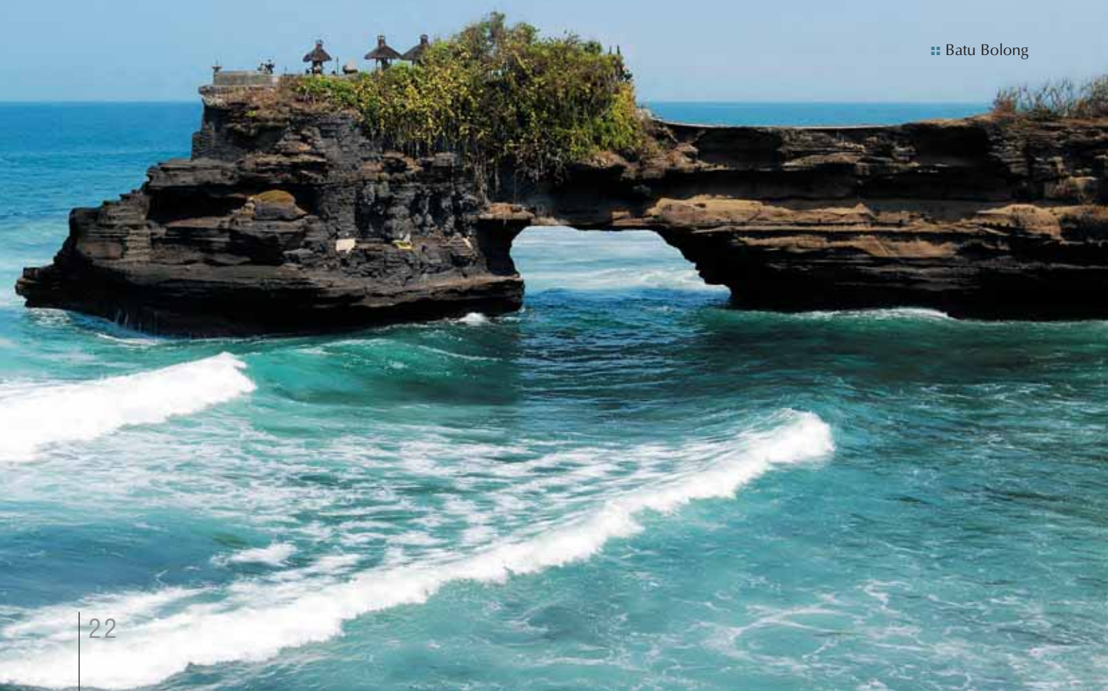
❖ Batu Bolong